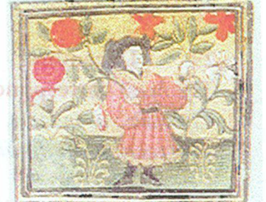
Avril : Visite au jardin