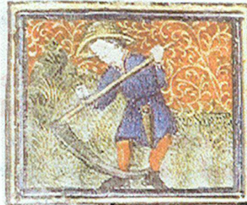
Jun : la fenaison