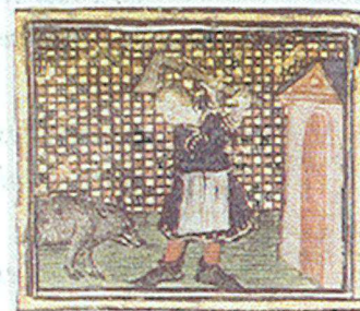
DÉCEMBRE : Tuage du cochon