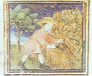
Juillet : la moisson