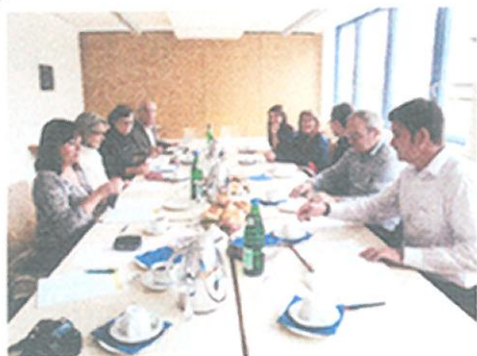
Rencontre à la Mairie de Schwabach

Comme chaque année et pour la 22 ème fois le Marché de Noël traditionnel de Vern s'est déroulé le 10 décembre 2012. Pour la deuxième fois, ce marché se déroulait dans la salle des fêtes de la Chalotais.