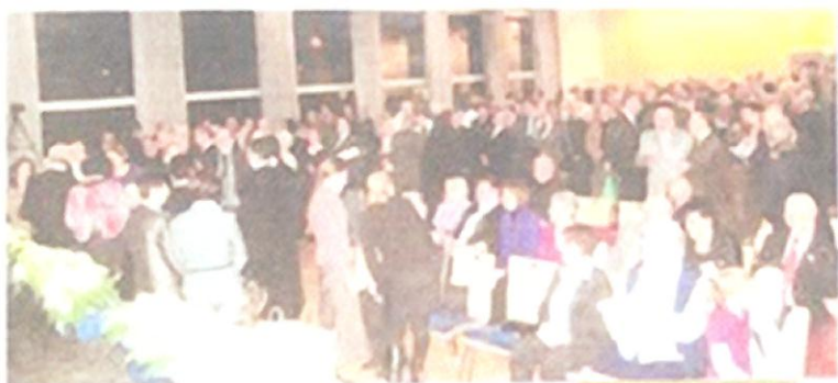
Les représentants d'associations et les citoyens sont venus nombreux pour honorer les 2 maires.