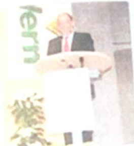
2 intervenants parmi les 5 ou 6 orateurs.