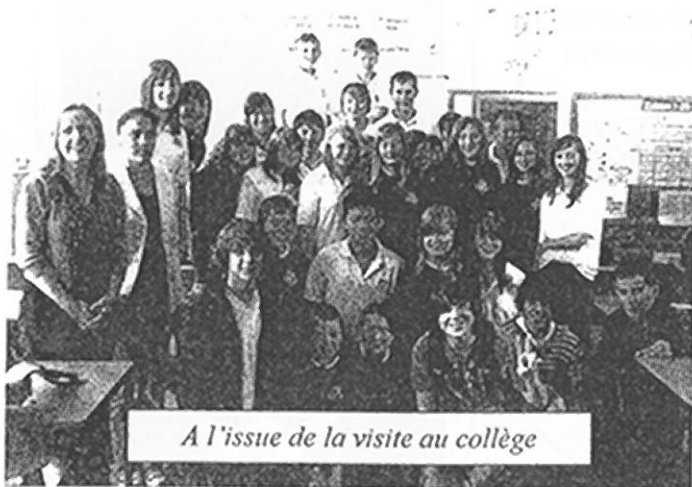
A l'issue de la visite au collège

Après 1 an d'échanges et de discussions, le projet Angleterre mené conjointement avec la passerelle a enfin pu aboutir. Mais cela valait le coup d'attendre, car le séjour a été une réussite complète, tant du point de vue des jeunes que de nos amis Anglais qui encore une fois ont répondu à notre attente. Pendant une semaine (du 6 au 13 juillet 2009), dix jeunes de 16 ans à 18 ans (7 de la passerelle et 3 du comité de jumelage) ont été accueillis par 2 dans les familles anglaises autour du lac de Chew Valley. Pendant cette semaine, ils ont pu visiter Bristol (le musée), Bath (les bains et la ville), Cheddar (le village et la campagne) et goûter à la vie anglaise. Les soirées au pub à jouer au bowling ou à des jeux bretons ont permis un échange avec les familles et les jeunes.