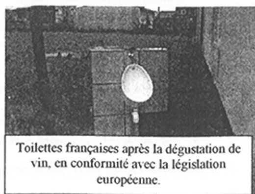
Toilettes françaises après la dégustation de vin, en conformité avec la législation européenne.

Pourquoi les pique-niques français sont-ils nettement plus savoureux que les nôtres ?