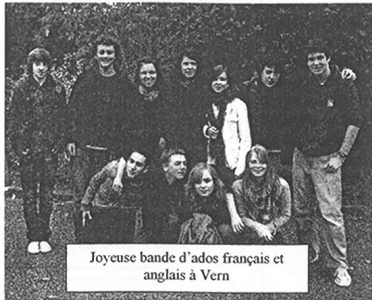
Joyeuse bande d'ados français et anglais à Vern

Un groupe de 35 personnes intrépides, de tous âges, a passé un long week-end extrêmement agréable à Vern à la fin du mois d'octobre. Lors de notre dernier séjour là-bas en 2006 il pleuvait beaucoup et nous avons donc été très contents de pouvoir montrer la campagne anglaise sous un soleil et une douceur inhabituelle pour la saison lorsque nos amis bretons sont venus nous voir en novembre 2007. Le temps en France était cette fois-ci entre les deux – un peu de crachin et un peu de soleil mais la même atmosphère « bon enfant ».