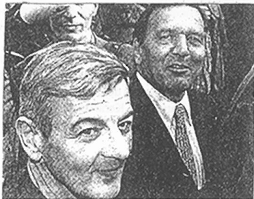
J. Fischer, le leader des Verts, et G. Schröder : le « nouveau centre » promet beaucoup de changements, avant la formation du gouvernement.

Suite à ces dernières élections qui ont vu la victoire du SPD, le nouveau Parlement a élu le mardi 27 octobre le chancelier qui avait été proposé au préalable par le Président de la République (en l'occurrence le Chrétien démocrate Roman Herzog) en fonction du résultat des élections. C'est ainsi que le Social-Démocrate Gerhard Schröder (candidat à la Chancellerie du SPD) a mis fin à seize années de l'ère Helmut Kohl.