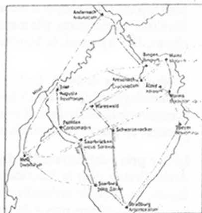
« Principales voies romaines »

Et ce n'est qu'en 1957 que cet ancien « Territoire de la Sarre » (en allemand Saargebiet) devint « Saarland ».